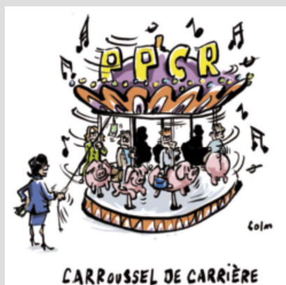
Grille des PE jusqu'au 31/08/2017

Vous trouverez ci-dessous un tableau détaillant le rythme de passage d'un échelon à l'autre ainsi que les anciennes grilles d'avancement. ■